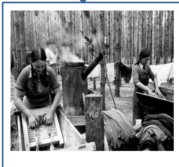
Через руки банно-прачечного отряда прошло почти 6,8 млн кг белья, то есть в среднем по 57 т в день!