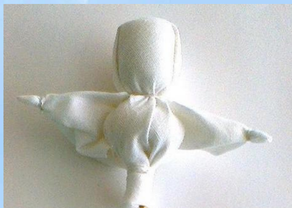
Рис 5. Подкладываем вату, формируем грудь, заправляем нижние уголки внутрь, выравниваем, и завязываем по линии талии ниткой.

Рис 4. Расправляем концы ткани, загибаем края ткани внутрь, формируем и обматываем ниткой ладошки, завязываем на 2 узелка, концы ниток обрезаем.